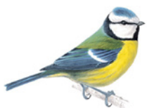
4. sýkora modřinka