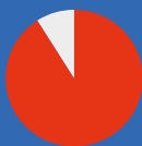
sýkora koňadra (91 %)