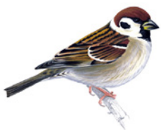
2. vrabec polní