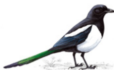
9. straka obecná