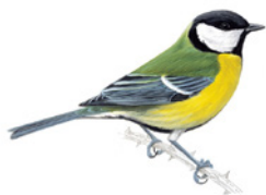
1. sýkora koňadra Ptačí hodinka 2020