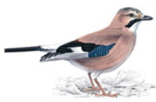
14. sojka obecná