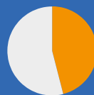
vrabec polní (46 %)