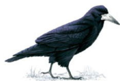
11. havran polní