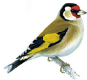
8. stehlík obecný