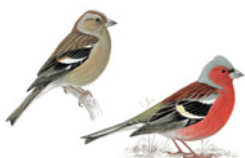
13. pěnkava obecná