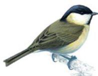
15. sýkora babka