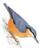
10. brhlík lesní