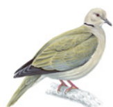
5. hrdlička zahradní