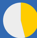
hrdlička zahradní (46 %)

O datech: Výsledky zahrnují pouze sčítání z 10.–12. ledna 2020. Velmi nepravděpodobná pozorování a sčítání nedodržující metodiku byla ze zpracování vyřazena.