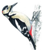
12. strakapoud velký