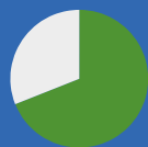
sýkora modřinka (69 %)