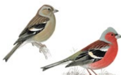
12. pěnkava obecná