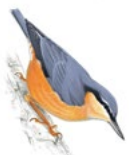
13. brhlík lesní