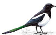
11. straka obecná