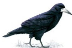
10. havran polní