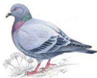
14. holub domácí