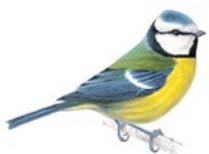
4. sýkora modřinka