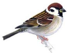
2. vrabec polní