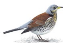
15. drozd kvíčala