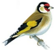
8. stehlík obecný