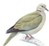
5. hrdlička zahradní