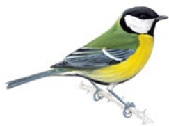
1. sýkora koňadra Ptačí hodinka 2021