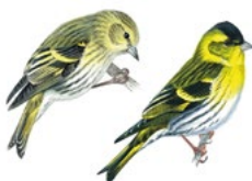
9. čížek lesní